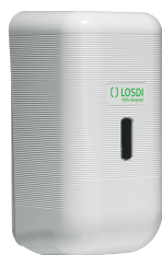
REF: CJ-3014-B Acabamento BRANCO