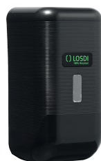
REF: CJ-3014-BL Acabamento PRETO