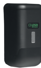
REF: CJ-3014-MT Acabamento PRETO FOSCO