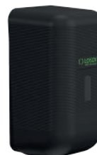
REF: CJ-3014-MT Acabado NEGRO MATE