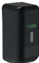
REF: CJ-3014-BL Acabado NEGRO