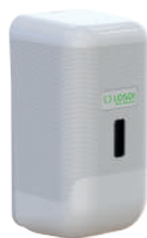
REF: CJ-3014-B Acabado BLANCO