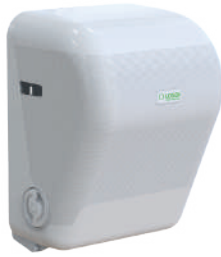
REF: CP-3525-B Acabado BLANCO