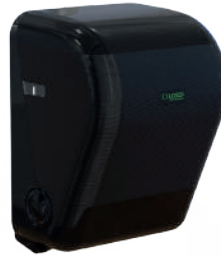
REF: CP-3525-BL Acabado NEGRO