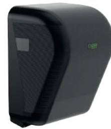
REF: CP-3525-MT Acabado NEGRO MATE