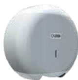
REF: CP-3006-B BRANCO