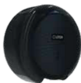
REF: CP-3006-BL PRETO